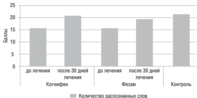
Рис. 3. Результаты теста Мюнстерберга

чувствия, активности и настроения практически не отличались во всех группах пациентов и были значительно ниже, чем у лиц контрольной группы ( p < 0,05 ). Однако после 30-дневной терапии в результате применения когнифена значительно улучшились показатели активности и настроения ( p < 0,01 ) и существенно ( p < 0,05 ) – самочувствия. Полученные результаты сопоставимы с контрольными цифрами. Месячный прием фезама способствовал умеренному улучшению самочувствия и настроения ( p < 0,05 ). Обращает на себя внимание практически полное отсутствие стимулирующего влияния данного препарата на общую активность пациентов, как в динамике лечения, так и по сравнению с контролем. 28 пациентов группы фезама дополнительно отмечали сонливость вследствие приема препарата.