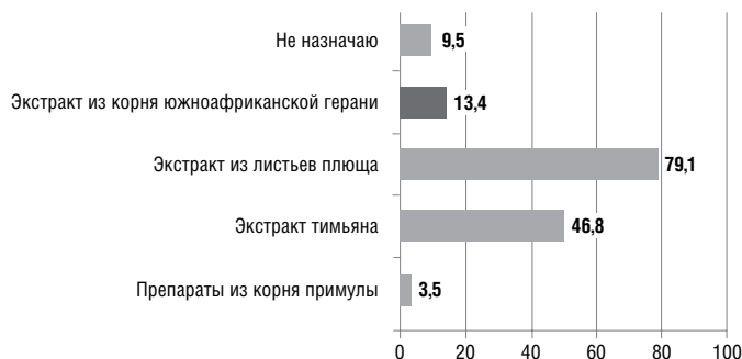
Рис. 4. Положительные ответы (%) врачей-терапевтов на вопрос о том, какие растительные лекарственные средства они используют для лечения больных острым бронхитом