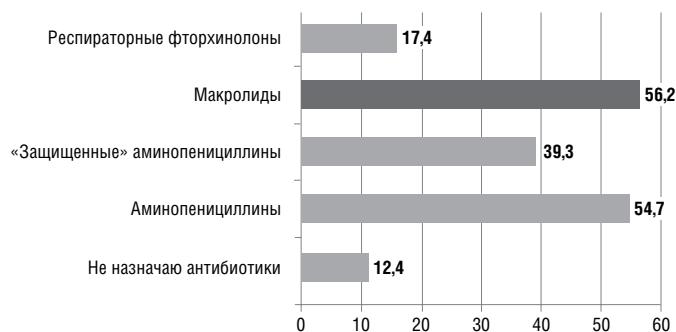
Рис. 3. Положительные ответы (%) врачей-терапевтов на вопрос о том, какой (какие) классы антибиотиков они используют для лечения больных острым бронхитом