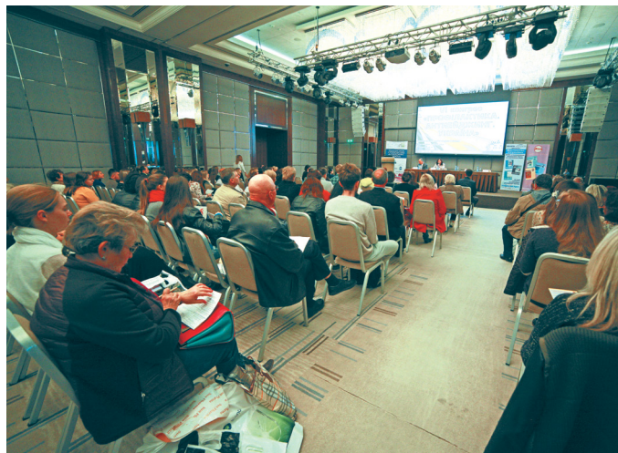
VI Конгрес «Профілактика. Антиейджинг. Україна», м. Харків

Яскравою подією цієї осені серед українських лікарів став VI Конгрес «Профілактика. Антиейджинг. Україна», який в цьому році відбувся 28–29 вересня у м. Харків. Вперше конгрес проходив у цьому місті і мав дуже високу популярність серед лікарів не лише Харкова та Харківської області, а і лікарів з різних куточків України, які мали можливість відвідати його. Захід пройшов за підтримки Міністерства охорони здоров'я України, Національного медичного університету імені О.О. Богомольця (Київ), Національної медичної академії післядипломної освіти імені П.Л. Шупика (Київ), Харківського національного медичного університету, Харківської медичної академії післядипломної освіти, ДУ «Національний інститут терапії імені Л.Т. Малої НАМН України», Департаменту охорони здоров'я Харківської міської ради, Департаменту охорони здоров'я Харківської обласної державної адміністрації.