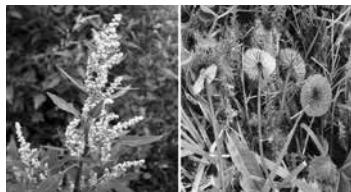
Протокол надання медичної допомоги хворим на алергічний риніт. Додаток до наказу МОЗ України №432